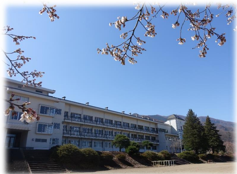
* 春光うらかな佳き日となった 入学式